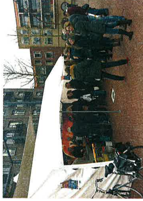
Goede doelen markt Bennekom